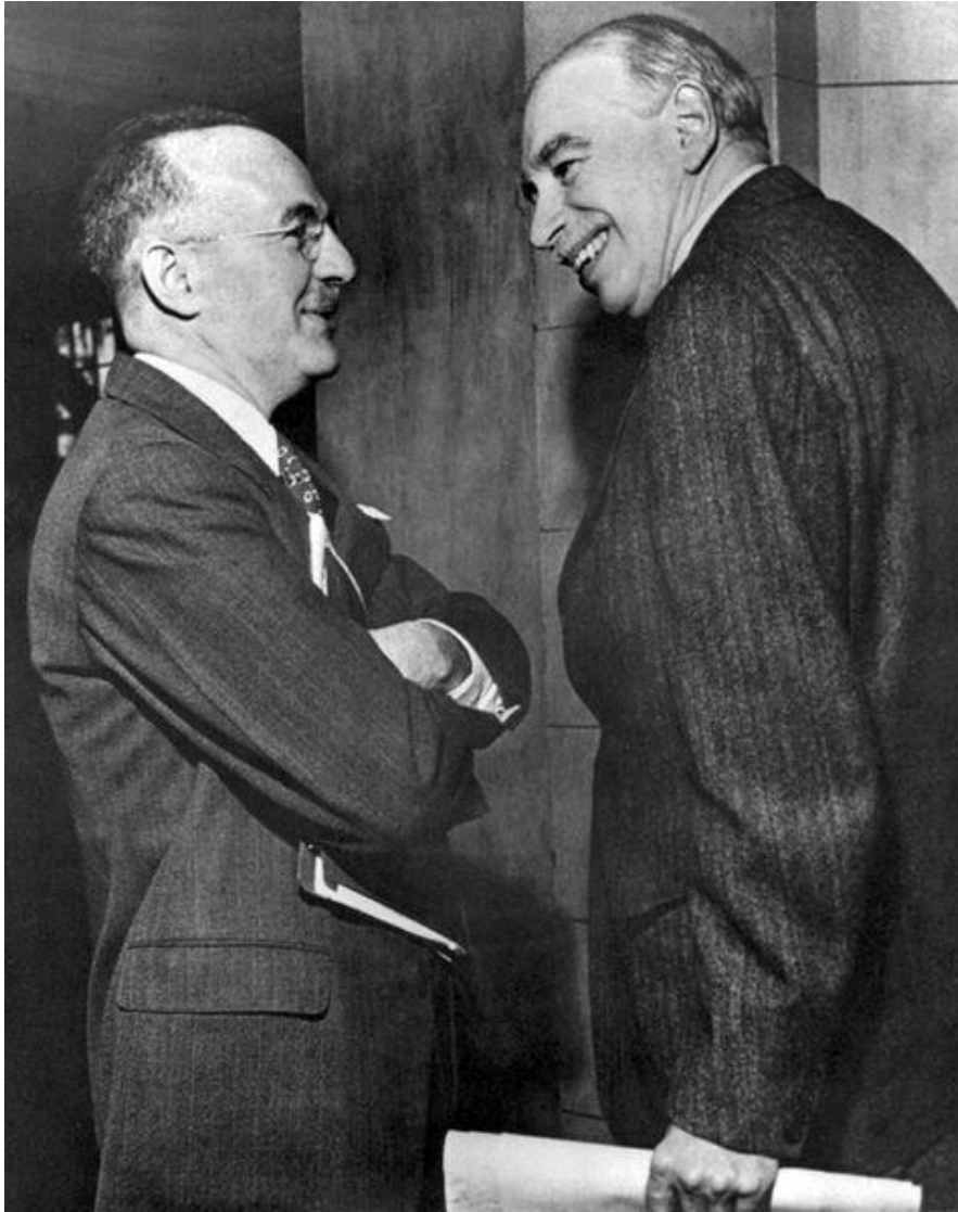
Keynes (dreta) a la primera reunió de la junta de governadors de l'FMI.

Per descomptat, el seu segrest ideològic per les esquerres no reflecteix el pensament de Keynes. La caracterització del keynesianisme com a teoria econòmica basada en la despesa peca de simplisme. El que defensava Keynes era una política contracíclica que esmorteís els vaivens del cycle econòmic —és cert que això comporta un estímul fiscal per evitar que l'economia es refredi massa durant les crisis (com apunten els socialistes), però és igual de cert que també comporta una reducció de la despesa governamental durant els anys de prosperitat per tal de contenir la inflació, evitar que l'economia se sobreescalfi i garantir un coixí per a futures crisis (com no apunten els socialistes). Aquest últim punt és essencial, ja que implica que els diners invertits en una política expansiva durant les crisis no han de sortir de l'endeutament, sinó dels estalvis generats durant els anys de prosperitat. Hi ha un clar contrast amb la manera de fer socialista, que preconitza despesa durant les males èpoques (amb el motiu de «Keynes»)... i les bones (amb el motiu de «gastem perquè ens ho podem permetre»).