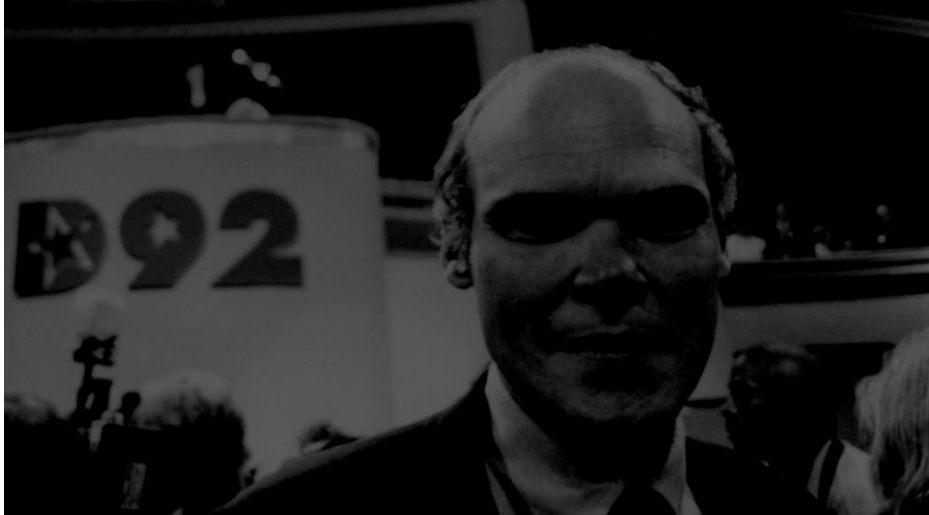
James Carville a les eleccions americanes de 1992

unes eleccions constituents i un referèndum sobre la independència.