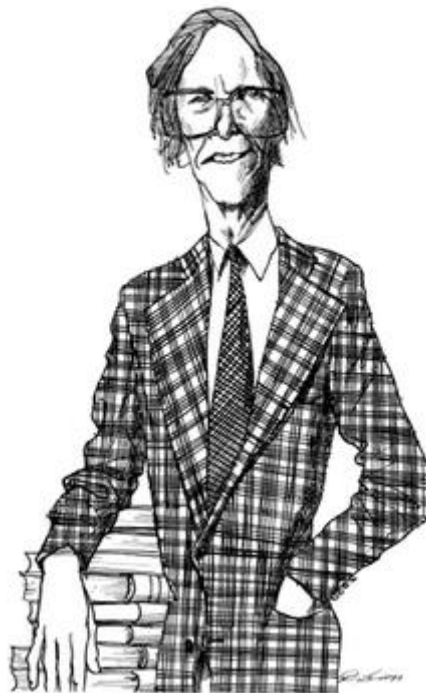
Retrat de John Rawls.

Una primera resposta podria ser: repartim-ho de tal manera que maximitzem el benestar de tothom. És a dir, calculem la felicitat de cadascú en relació a la consumició del gintònic, sumem-ho i sabrem com repartir-ho. Per exemple, aquells als que clarament la consumició del combinat els farà estar molt més feliços en comparació amb la resta haurien de ser els primers de ser servits. Així, ordenem les vuit persones de manera que servim a aquell que serà més feliç el primer i al que ho serà menys l'últim. Intuïtivament, aquesta proposta podria semblar interessant, però tindria dos problemes. El primer és de factibilitat: com calculem la felicitat que ens aporta a cadascú la consumició del combinat d'una manera objectiva? La segona és de tipus moral: és possible que els darrers en ser servits es quedin sense res, cosa que podria comportar una injustícia. Però, per què seria una injustícia? Per a un utilitarista (és a dir, aquells que defensarien la proposta esmentada), no hi hauria cap injustícia. L'única mesura de la moral és assolir la màxima felicitat agregada. En canvi, algú podria dir que hi ha quelcom d'injust en el fet que tothom hagi pagat per un combinat però alguns en beguin i d'altres no.