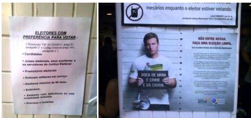
Dos imágenes interesantes. A la izquierda, una circular ordenando que algunas personas (candidatos, jueces y promotores electorales, policías, electores mayores de 60 años, enfermos o personas en situación de dependencia) tienen preferencia al votar. A la derecha, propaganda de la junta electoral, pidiendo una campaña y un debate limpios.

Los sondeos y las encuestas llegaron a entrar en una fase de confusión, pues aun sabiendo que la sociedad brasileña se sabe cansada ante el despegue económico, culpando a Dilma y al PT de muchos de los errores cometidos, siguen apoyándolos, pero cuando se trataba de contestar a una pregunta simple en alguna encuesta, respondían negativamente hacia los intereses de la ganadora. Como vemos, el cálculo racional de la decisión del voto da bandazos, tanto en las playas mediterráneas como en las de Copacabana.