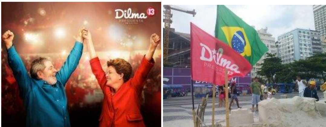
Campanya electoral de Dilma, a l'esquerra una imatge amb Lula, el seu predecessor i gurú; a la dreta, una banderola de Dilma amb la bandera brasilera plantades a Copacabana.

Com en molts altres països, els electors brasilers basen la seva decisió en múltiples variables, com la religió, les polítiques socials, factors socioeconòmics personals o les promeses d'un o altre candidat. Brasil és una democràcia assentada on els votants saben fer el càlcul racional envers el candidat –en aquest cas, candidata – més ben preparat per a liderar el país. En aquestes eleccions executives, molts electors han tendit a votar basant-se en la contrarietat: a la primera volta, molts han votat a favor de Dilma o del seu gran oponent en la segona volta, Aécio Neves, tenint en compte més les faltes del contrari que els pros del favorit.