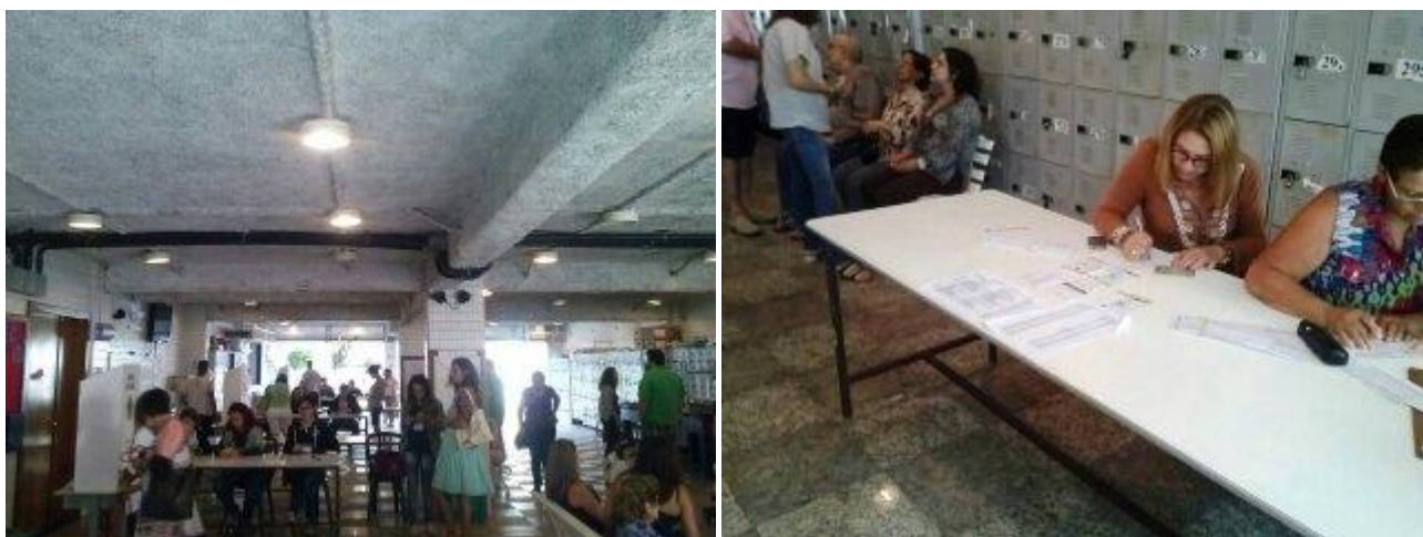
Colegio electoral en Rio de Janeiro, el domingo 26 Octubre 2014.

Para hacer mas interesante el partido, los medios han querido presentar a Aécio Neves , del Partido Socialdemócrata Brasileño (PSDB) como un rival formidable para Rousseff, pero lo cierto es que, si echamos un vistazo a los resultados de la primera vuelta (miércoles 5 de Octubre), veremos que Dilma se llevó el 46,6% de los sufragios, seguida por Aécio (33,6%) y Marina Silva (21,3%). Estaba claro desde entonces que Dilma podría ganar, incluso con un suficiente 51,6% en la segunda vuelta, frente al 48,4% de Neves.