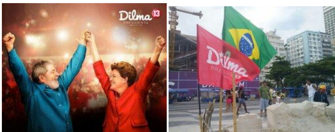
Campaña electoral de Dilma, a la izquierda una imagen junto a Lula, su predecesor y gurú; a la derecha, una banderola de Dilma junto a la bandera brasileña plantadas en Copacabana.

Como en otros muchos países, los electores brasileños basan su decisión en múltiples variables, como la religión, políticas sociales, factores socioeconómicos personales o las promesas de uno u otro candidato. Brasil es una democracia asentada cuyos votantes saben hacer el cálculo racional para con el candidato –en este caso, candidata – mejor preparado para liderar el país. En estas elecciones ejecutivas, muchos electores han tendido a votar basándose en la contrariedad: en la primera vuelta, muchos han votado a favor de Dilma o de su gran oponente en la segunda vuelta, Aécio Neves, teniendo en cuenta más las faltas del contrario que los pros del favorito.