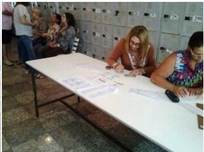
Col·legi electoral a Rio de Janeiro, diumenge 26 Octubre 2014.