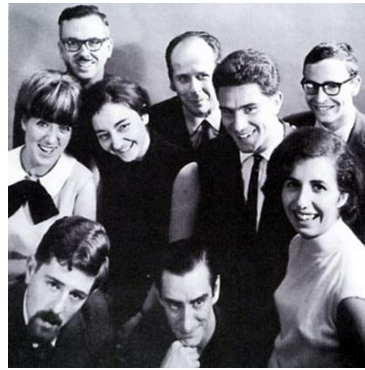
La Nova Cançó tingué com un dels màxims exponents musicals els Setze Jutges (dreta)

Dissortadament i amb el pas dels anys les tensions internes i l'entrada de la democràcia va fer que aquest tipus de música anés reculant durant els anys 80, on la "Movida Madrileña" i altres expressions artístiques i polítiques fetes en castellà van anar agafant força. Van ser uns anys foscos per la música en català que no va saber adaptar-se als nous temps i les noves tendències imposades per la moda punk anglesa i el reage jamaicà.